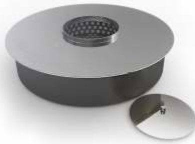
ROUND BURNER L - OS