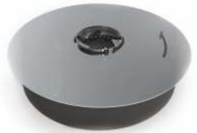
ROUND BURNER L